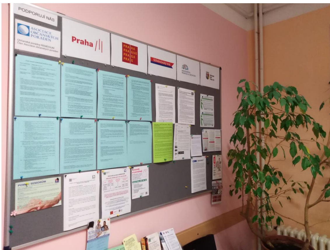
Čekárna Občanské poradny REMEDIUM