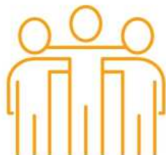
...a naši dárci jednotlivci