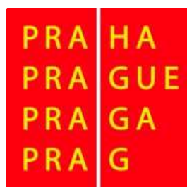
Hlavní město Praha