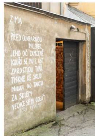
Venuše ve Švehlovce, foto: Kateřina Červená

Představení choreografa Martina Talagy SOMA # 89: REUNION bylo dotvořeno v rámci workshopu tvůrčí proces v praxi čerpá inspiraci z prostoru, z jeho dějin, zaměření nebo jeho přítomnosti – taktéž ve spolupráci s Divadlem Venuše ve Švehlovce. Divadelní umělci, kteří před deseti lety našli domov v sále Švehlovky koleje pozvali na oslavu kulatého výročí, jež bylo zároveň připomínkou stých narozenin architektonicky významné budovy a rondokubického sálu v Praze – večírek Hihahahaholky + DJ Lil Autotune – 10. výročí Venuše ve Švehlovce propojil historickou a současnou funkci významného sálu v lehce dekadentní kabaretní přehlídce, kde si mohli účastníci i zatančit nebo se nechat unášet i performance drag queens z kabaretu PINKBUS. Palác (volného) času je název výstavy, na jejíž zahradní slavnost včetně komentované prohlídky výstavou pozvaly veřejnost kurátorky Galerie hl. mšsta Prahy do Zámku Troja.