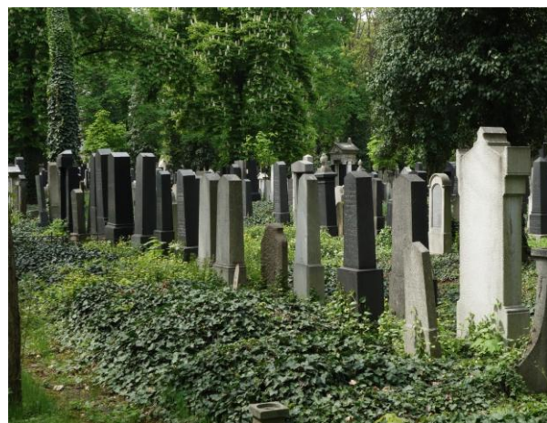
ukázky - stav před provedením prací