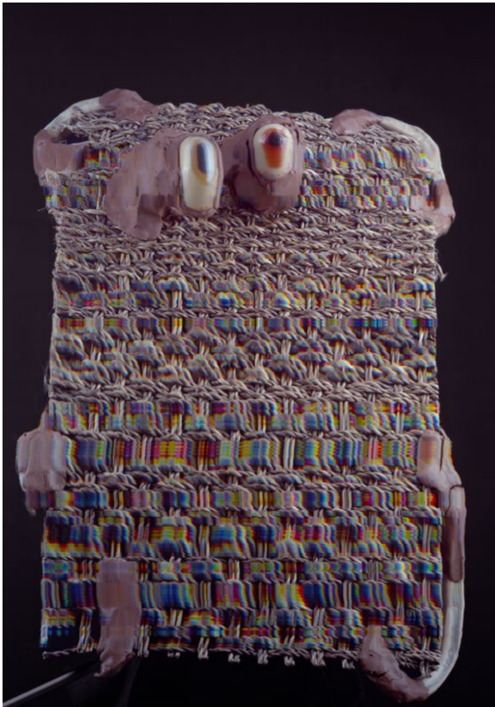
Bez názvu, digitální fotografie, 2019