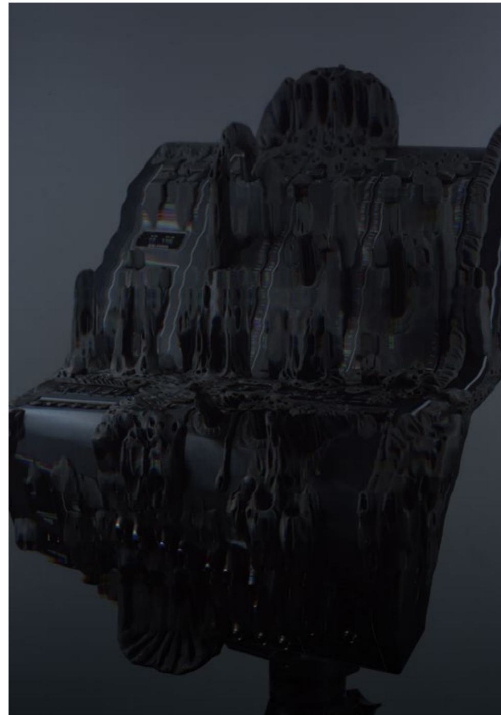
Bez názvu, digitální fotografie, 2019