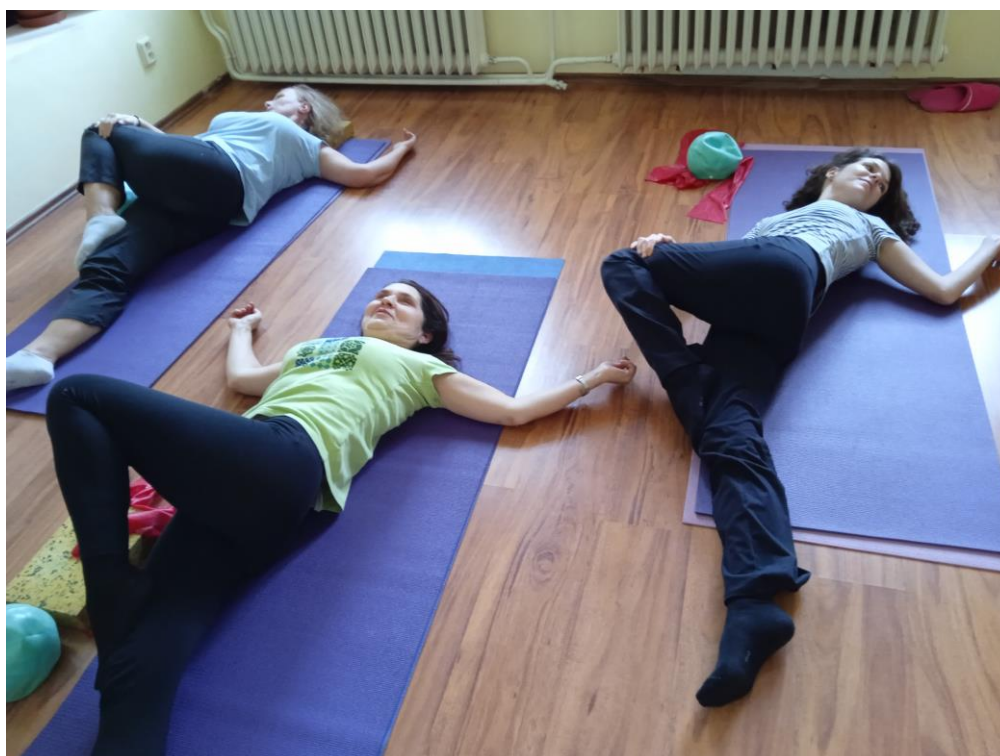
Cvičení pro onkologicky nemocné