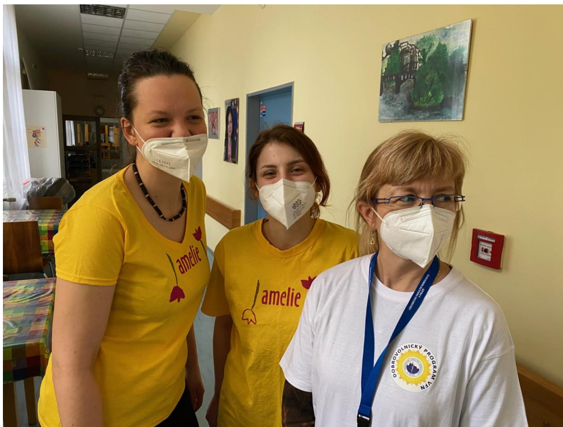
Dobrovolníci připravují výzdobu v nemocnici