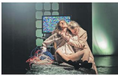
Záběr z inscenace Očistec si zaslouží každý divadelního „gangu“ Depresivní děti touží po penězích.

Minulou neděli pak vešlo do vědomostí i Divadlo Masopust. Stalo se tak v pražském Divadle Na zábradlí, v jehož podkrovním komorním sále, zvaném Eliadova knihovna, působil (zprvu kočující) Masopust