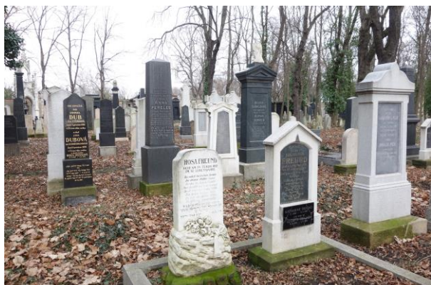
ukázky - stav před provedením prací