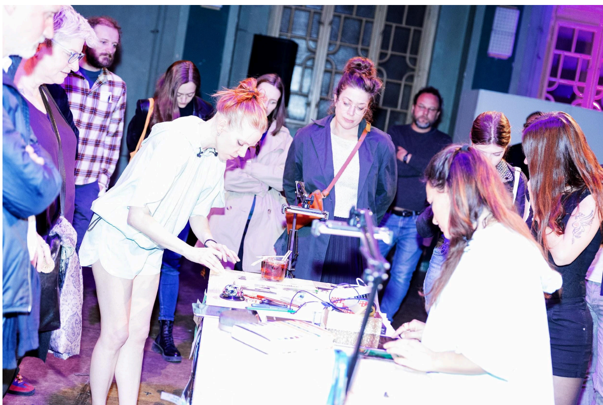
To město nikdy nevidíte (Beautiful Confusion Collective), premiéra 1.5.2023, Venušiny dny