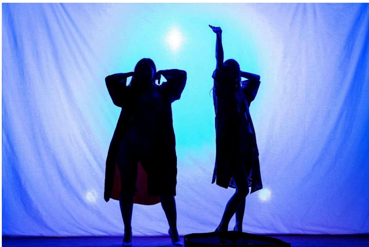
Cukrová vata: Party is Over (Divadlo NUDE, SK), pražská premiéra 28.4.2023, Venušiny dny