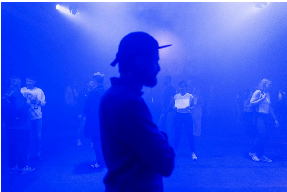
Playroom is Dark (Depresivní děti touží po pěníích) 2.6. 2023, veřejná prezentace workshopu