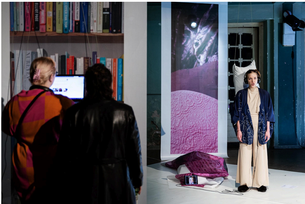
HYPO (Beautiful Confusion Collective), premiéra 12.12.2023