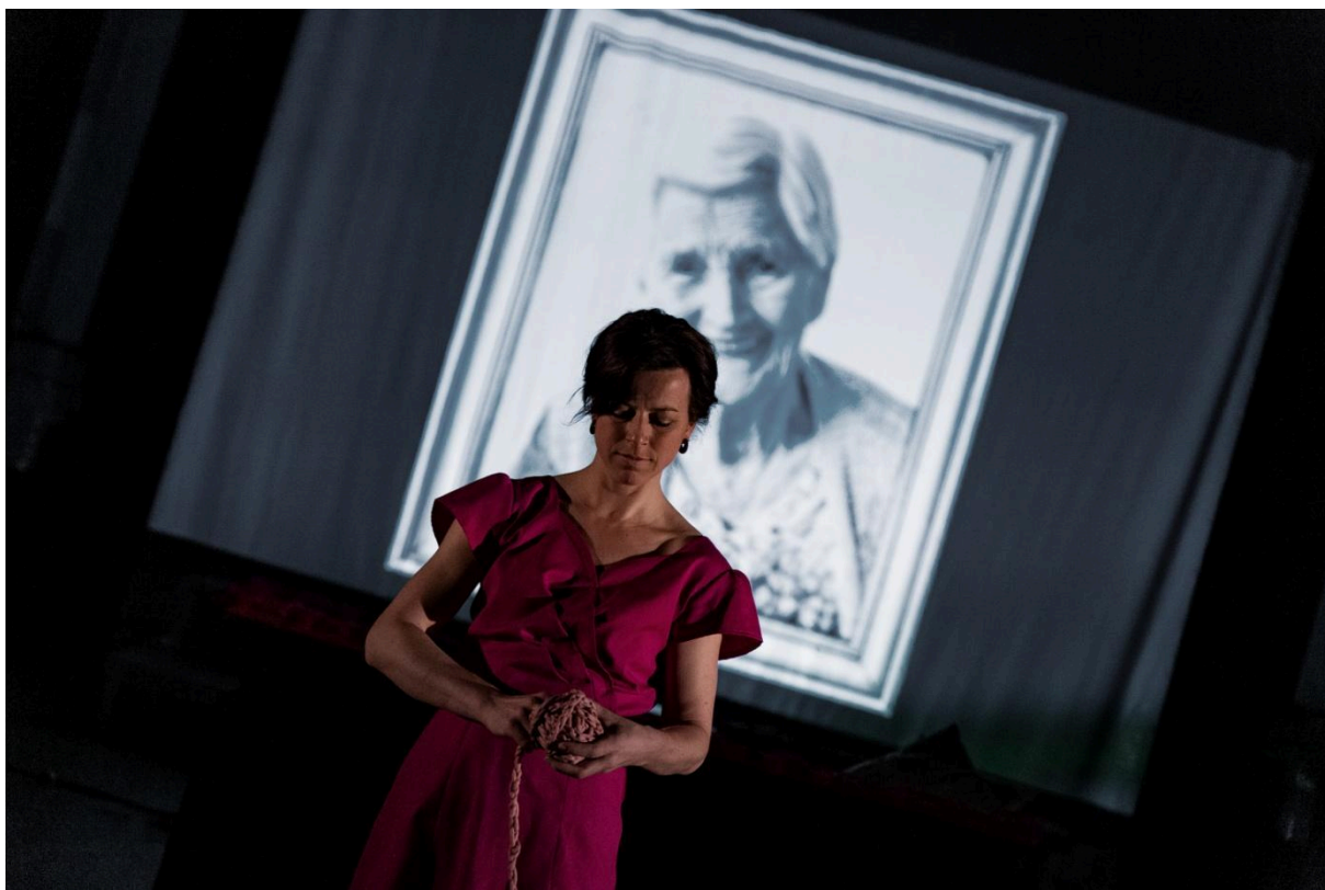
Odkaz (Spielraum Kollektiv) předpremiéra 29.4.2023 Venušiny dny