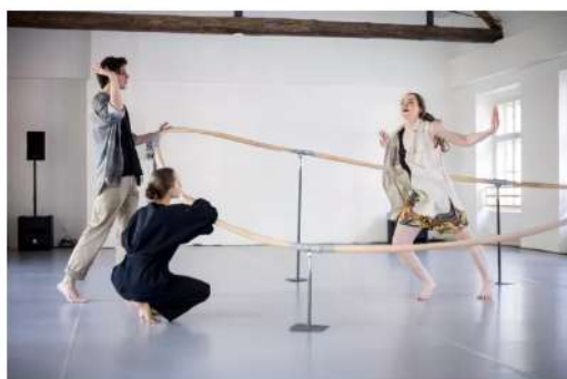
Invisible Traces.

Na cestě , interaktivní inscenaci pro děti, vytvořila Yana Reutova loni koncem srpna se čtyřmi tanečnicemi z Ukrajiny a dvěma hudebníky z ČR, a to díky podpoře Tance Praha, IDU a projektu Create to Connect, nadace VIA a nadace Člověk člověku. Na žižkovském Kostnickém náměstí to bude za ten krátký čas již 15. repríza.