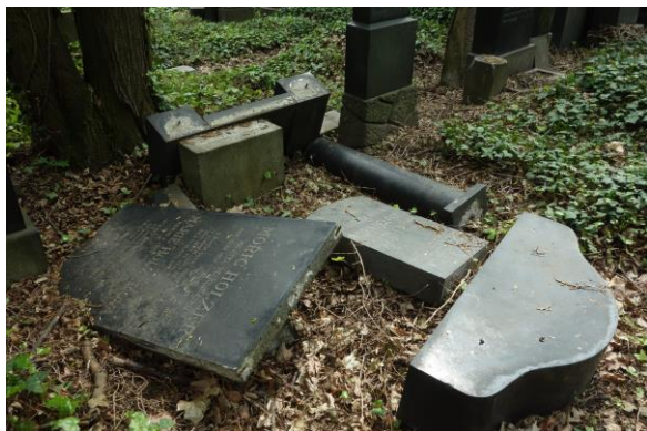
ukázka - stav před provedením prací