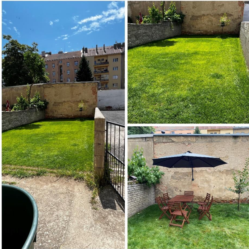
4) Nový povrch – stav PŘED vs. PO realizaci projektu: