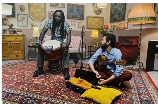
PROJEKT MLADÍ LADÍ DĚTEM.

PRAHA Populární festival Mladí ladí jazz přichází s novým projektem. V devíti lekcích s americkým jazzmanem Oranem Etkinem dostanou děti