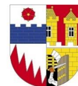
Městská část Praha 15