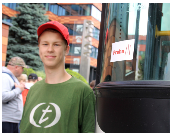
odjezd na tábor s logem Prahy III ☺