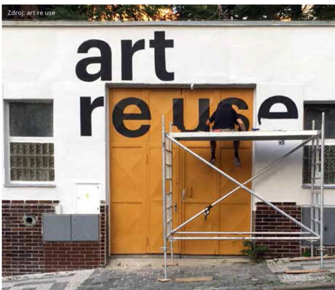
Objekt skladu o celkové rozloze 271 m 2 (Chlumova 257/8, Praha 3 - Žižkov)

Na základní funkci skladu navazuje cílená distribuce materiálu zpět do kulturního