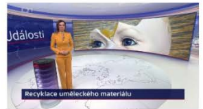
VIDEO: Události ČT