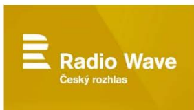
AUDIO: Radio Wave