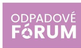
PRESS: Odpadové fórum