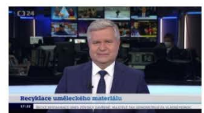
VIDEO: Studio ČT24