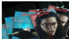
PRESS: Qartal 05